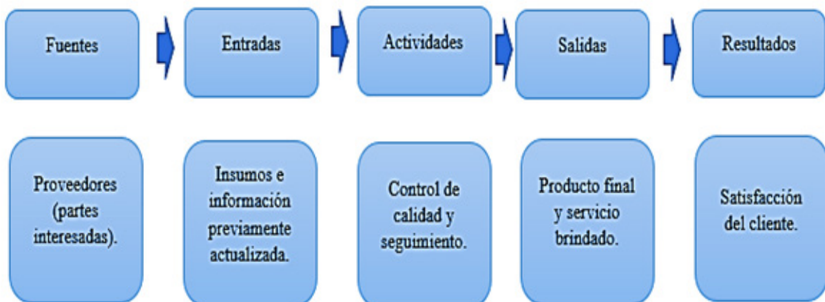
Figura 2. Representación esquemática de la sistematización de una empresa.

En la parte operativa, la sistematización se encuentra organizada como se muestra en la Figura 2, en donde, se resaltan aspectos claves como las entradas y salidas que son clave durante la etapa de evaluación del rendimiento y productividad por parte áreas automatizadas y mecánicas.